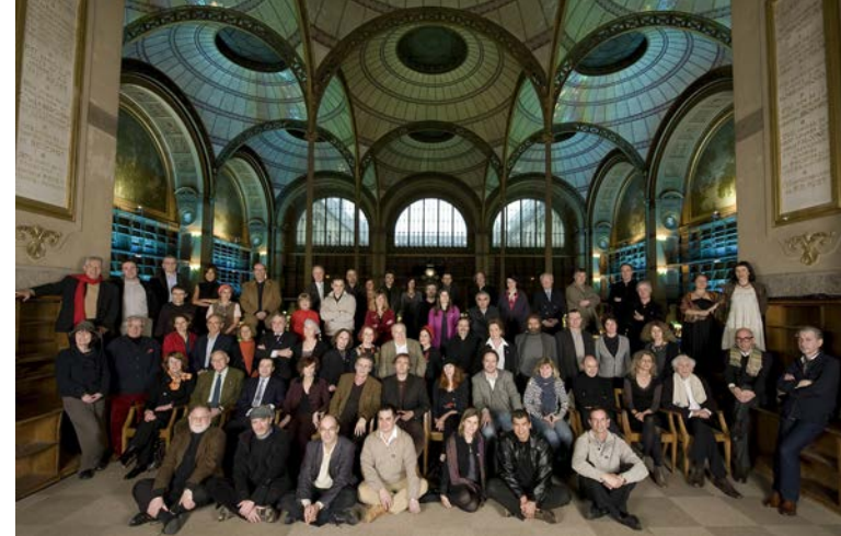
Les écrivains réunis à la BnF Richelieu à l'occasion des 10 ans de Lire et faire lire (2010).

Plus de 170 écrivains soutiennent Lire et faire lire